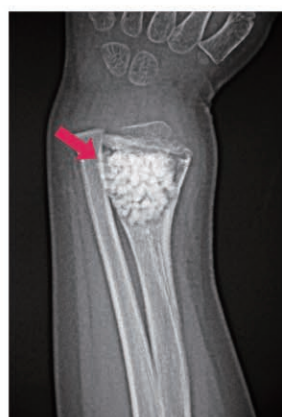
搔爬+人工骨充填後