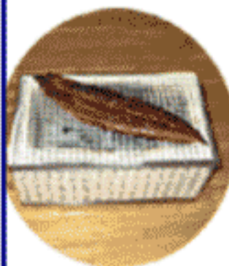
焼いた時のけむりもたまりません！

これらの食品は昔から精をつける滋養強壯食品と知られていますが、科学的根拠があったというわけです。