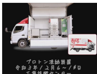
オンラインセミナーの内容の抜粋

この他にも、食のプラットフォーム勉強会（味の数値化勉強会 全3回）を配信しています。ご興味のある方は、食のプラットフォームのホームページよりアクセスしてみてください。