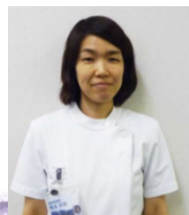
感染管理認定看護師