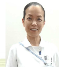
緩和ケア認定看護師