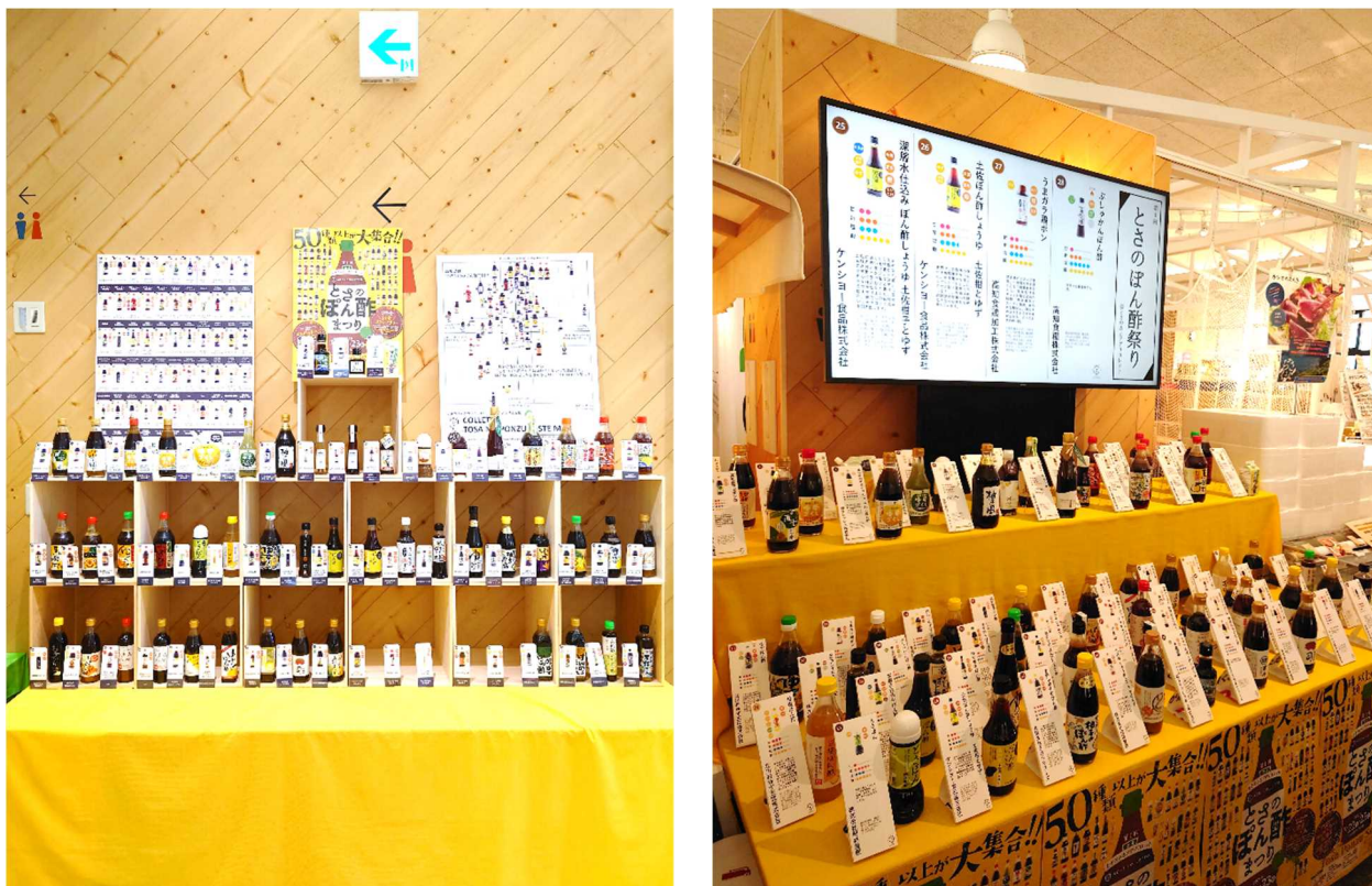
写真 とさのぽん酢まつりのようす

とさのさと AGRI COLLETTO（高知市北御座 10-10）にて「とさのぽん酢まつり」が開催されました。（令和5年7月22日、23日）当日は、県内約34社のぽん酢約60種類が販売され、うち17社の事業者が直売するイベントとなりました。来場者は、試食とテイストマップを参考にお気に入りのぽん酢を見つけるといった取り組みとなりました。