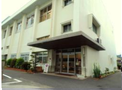
高知県立高知江の口養護学校

県教育委員会では、近年の病弱特別支援学校児童生徒の実態の変化に伴う教育的ニーズの多様化に対応し、教育内容や教育課程、施設設備の充実、教職員の専門性の向上等を図るため、教育・医療・労働・福祉等の関係者や保護者、県民の皆様から頂いた貴重なご意見を踏まえ、「高知県立特別支援学校再編振興計画【第二次】」を策定いたしました。