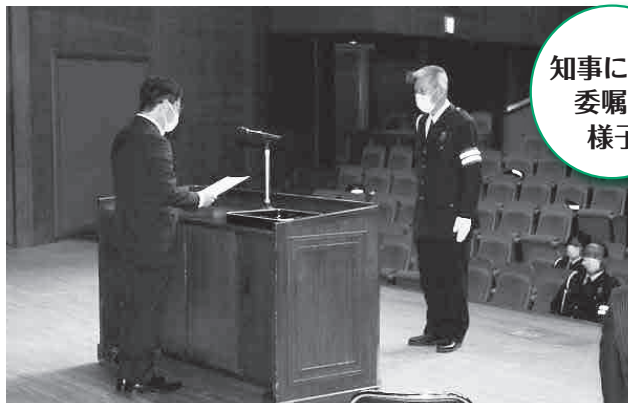
知事による 委嘱の 様子

高知県交通安全指導員は、交通戦争と言われていた昭和40年代、通学路などにおける交通安全指導のほか、地域のリーダーとして交通安全意識の普及啓発を行う交通ボランティアとして設置されました。