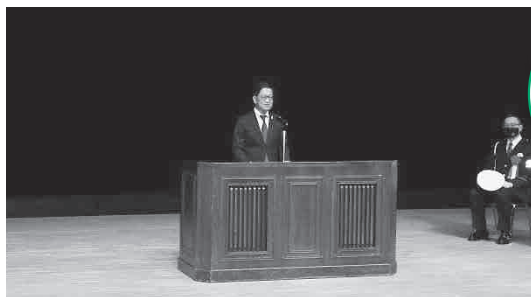
知事 あいさつの 様子

任期替えに伴い、令和3年4月5日(月)高知県立県民文化ホール(グリーンホール)で委嘱式が行われました。