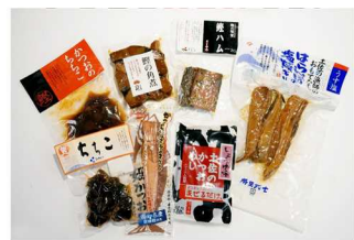
まるごとカツオセット