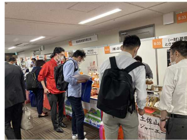
通販食品展示商談会