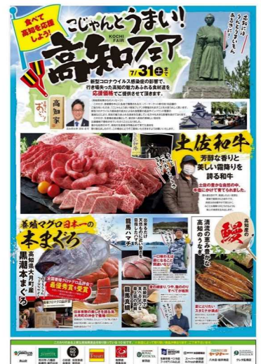
農林水産省の助成事業を 活用した高知フェア

土佐和牛、四万十鶏、トマト、メロン、スイカ、マンゴー、みかん、新生姜、マグロ、ハマチ、マダイ、うなぎ