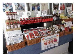
焼肉関連商品の大量陳列