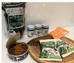
鰻・鮎・川のり「川の幸」セット

コロナ禍のため店頭でのお手伝いなどへのご協力をお願いできないことから、「おうちでまるごと高知」というコンセプトのもと、自宅にいながら高知を感じていただけるように高知県産品をお届けする定期便を毎週月曜日にメールマガジンでご案内いたしました。