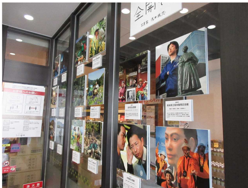
写真家 浅田政志さんの 「高知から笑顔あふれる写真展」