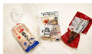
カツオのたたき食べ比べセット