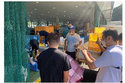
飲食店等による 漁港の視察