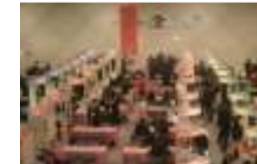
第45回 スーパーマーケット・トレードショー2011 SUPERMARKET TRADE SHOW