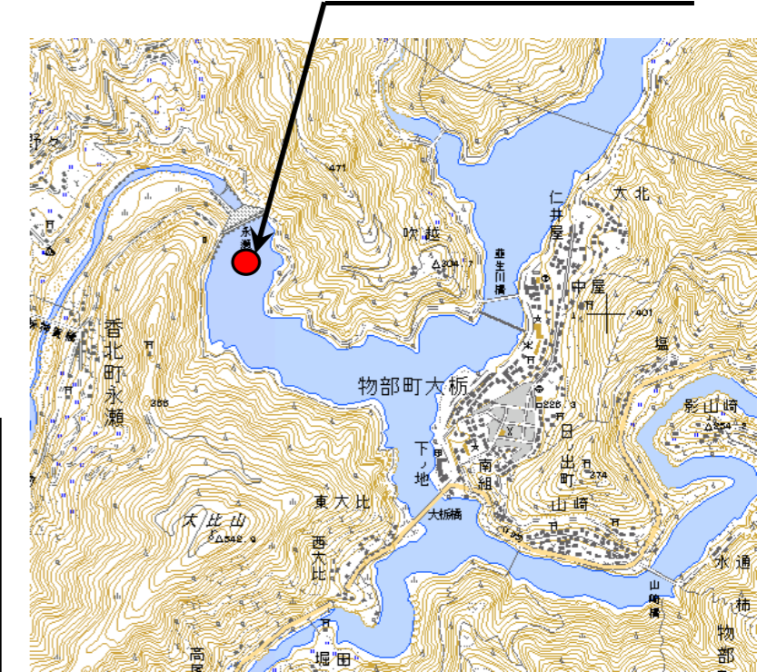
▲永瀬ダム周辺 位置図