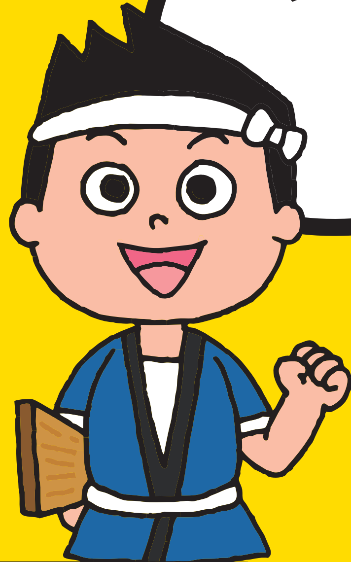
長男・耐震改修の大ちゃん

地震の後に発生する津波や火災からどうやって逃げますか？ あなたとあなたの家族を守るのは、あなた自身です。