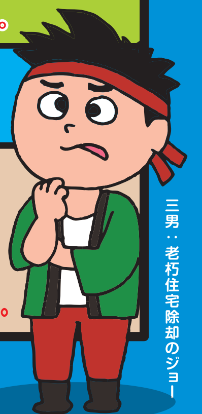
三男・老朽住宅除却のシム