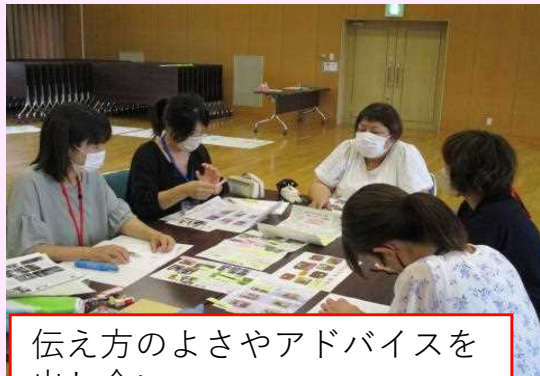
伝え方のよさやアドバイスを出し合い