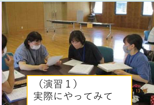
（演習1） 実際にやってみて

地域の身近な事例から体験的にみんなを感じて学び合いたい！そんな思いから今年度も演習1のロールプレイを通して、子どもを真ん中に保護者とよりよくつながる関わり方について考え合いました。そんな交流会の様子をちょっと紹介！