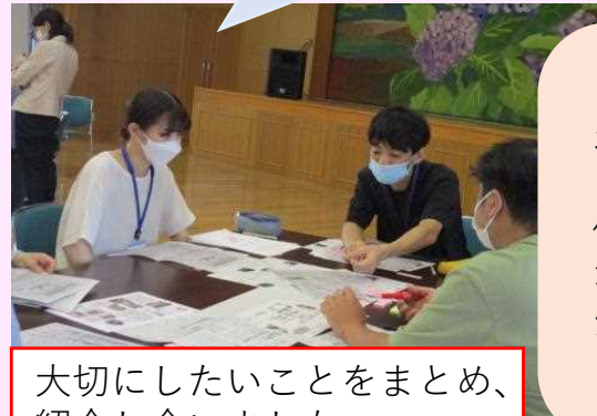
大切にしたいことをまとめ、紹介し合いました

演習2は、毎年好評のお手紙交流！今年度は「保育者の当たり前は保護者の当たり前ではない！いつもの書き手から読み手になって感じ取ろう！」