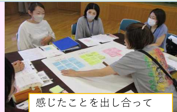
感じたことを出し合って