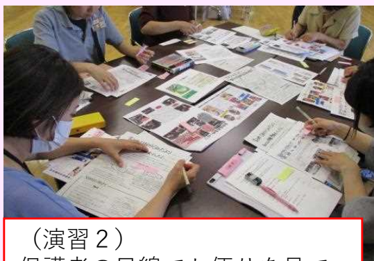
（演習2） 保護者の目線でお便りを見て