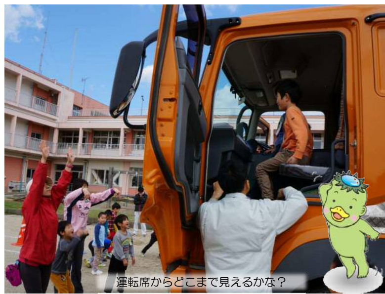
運転席からどこまで見えるかな？