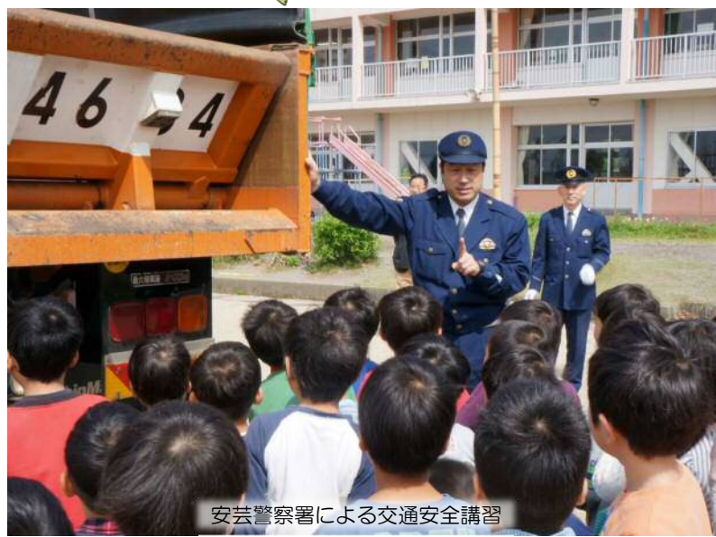
安芸警察署による交通安全講習