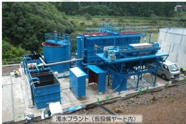
濁水プラント（仮設備ヤード内）