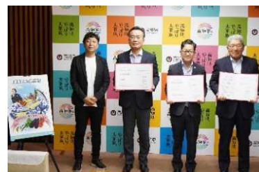
高知空港ビルとの協定締結式

コロナ禍により各種イベントが中止となる中で、「高知家の魚 応援の店」での高知フェア開催に向けた営業活動を展開したところ、「高知家の魚 応援の店」の新規登録や高知フェアの開催に繋げることができました。