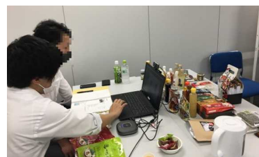
首都圏小売店等オンライン商談会

これまでのネットワークを活かして、小売店グループ、ホテル、飲食店、業務用卸といった様々な業種とのオンライン個別商談会を開催するなど、販路開拓をサポートしました。 (オンライン商談会の開催6回、出展社数延べ99社)