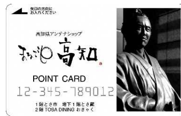
新ポイントカード