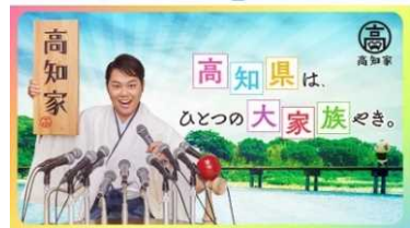
高知家のアニキが仲間入りし、 2020年度の高知家プロモーション始動！ 「高知県は、ひとつの大家族やき。」