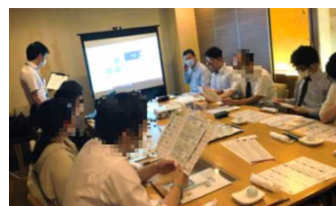
土佐酒オンライン勉強会

コロナ禍により出張や産地招へいが困難になる中で、遠隔によるWEB営業を行うとともに、バイヤーと高知県内の食品関連事業者とが合同で土佐酒のオンライン勉強会を実施しました。