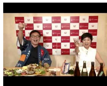
オンライン大おきやく