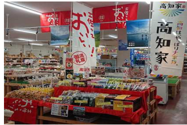
旬の駅高知フェア