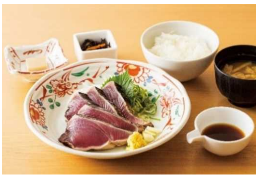
蕁焼きカツオのたたき御膳