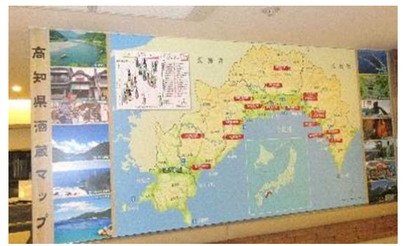
酒造会社入マップ (レストラン)