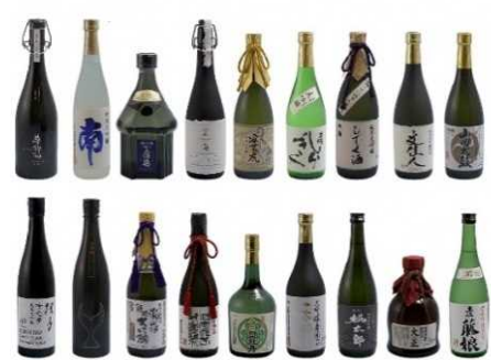
おうちでまるごと高知 (土佐18酒蔵スペシャルセット)