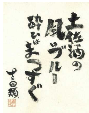
吉田類さんのメッセージ