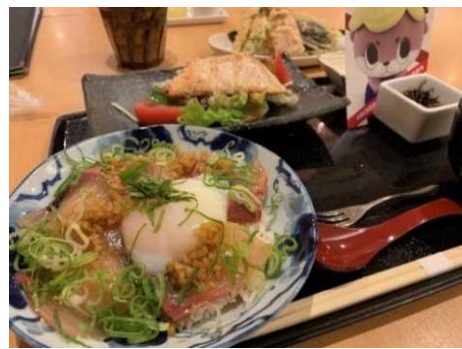
須崎カンパチ応援御膳