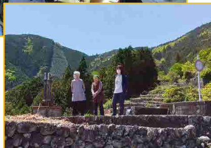
道の駅へお出かけランチ