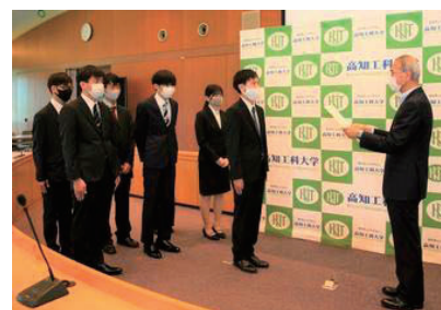
「高知県サイバー防犯ボランティア」委嘱の様子

県警察本部から委嘱をされ、Twitter のような SNS を中心に不適切な書き込みが掲載されていないか、また、インターネット上に情報の搾取を目的としたサイト(フィッシングサイト)がないかをパトロールしています。継続的に行うことを重視しており、メンバー各々が活動できる時間帯に主に個人単位で確認をしています。