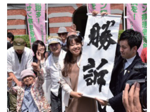
ハンセン病家族訴訟の熊本地裁前での勝訴発表2019年(令和元年)