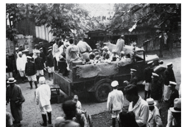
本妙寺部落の強制収容1940年(昭和15年)