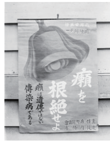
癩(らい)予防デーのポスター/1935年(昭和10年)

国が中心となって設立した癩(らい)予防協会が主催する、6月25日の癩(らい)予防デーを宣伝するもの。その趣旨は「癩(らい)を根絶」することにあった。