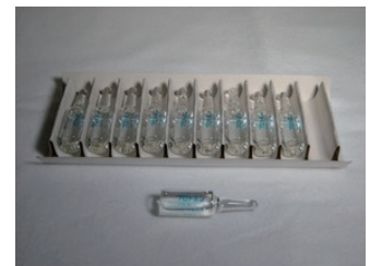
プロミン