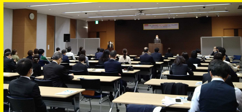
高知県子育て応援キャラクター「るんだ」

令和3年12月2日(木)、ちより街テラス・ちよテラホールで行われた「高知家 出会い・結婚・子育て応援フォーラム2021」。昨年は新型コロナウイルス感染症の影響を受け、開催を中止したため、2年ぶりの開催となりました。 今年のフォーラムは会場での開催に加え、リアルタイムでのオンライン配信も実施。Web視聴を含め、約100名の方に参加いただきました。 今回の応援団通信では、フォーラムの様子をお届けします！