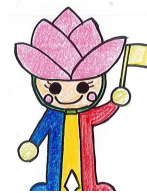
蓮池小安全キャラクター はーすちゃん