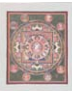
ブッダ-マンダラ ネパール 国立民族学博物館蔵

日 7月31日(木)まで 国立民族学博物館の所蔵品からチベットやネパールの絵画、立体マンダラを展示します。