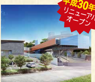
リニューアルイメージ図

博覧会第二幕(平成30年4月1日～)のメイン会場となる「県立坂本龍馬記念館」は、新館建設・リニューアル工事のため、4月1日から約1年間休館します。リニューアルオープンは平成30年春を予定しています。