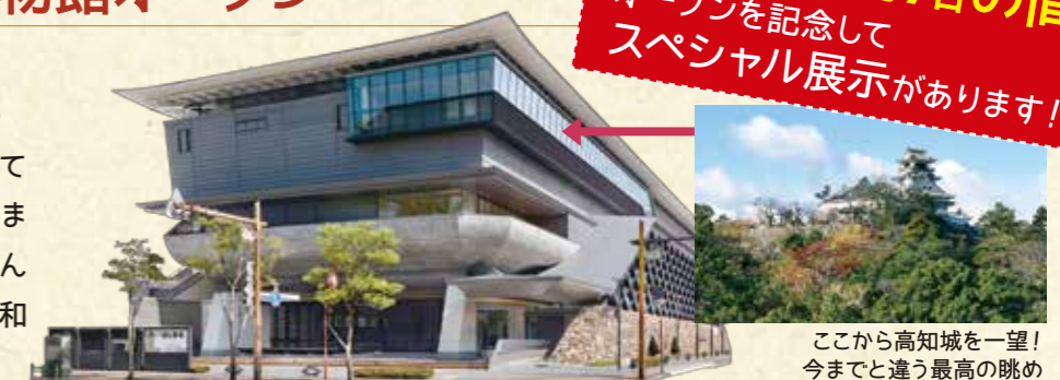
ここから高知城を一望! 今までと違う最高の眺め