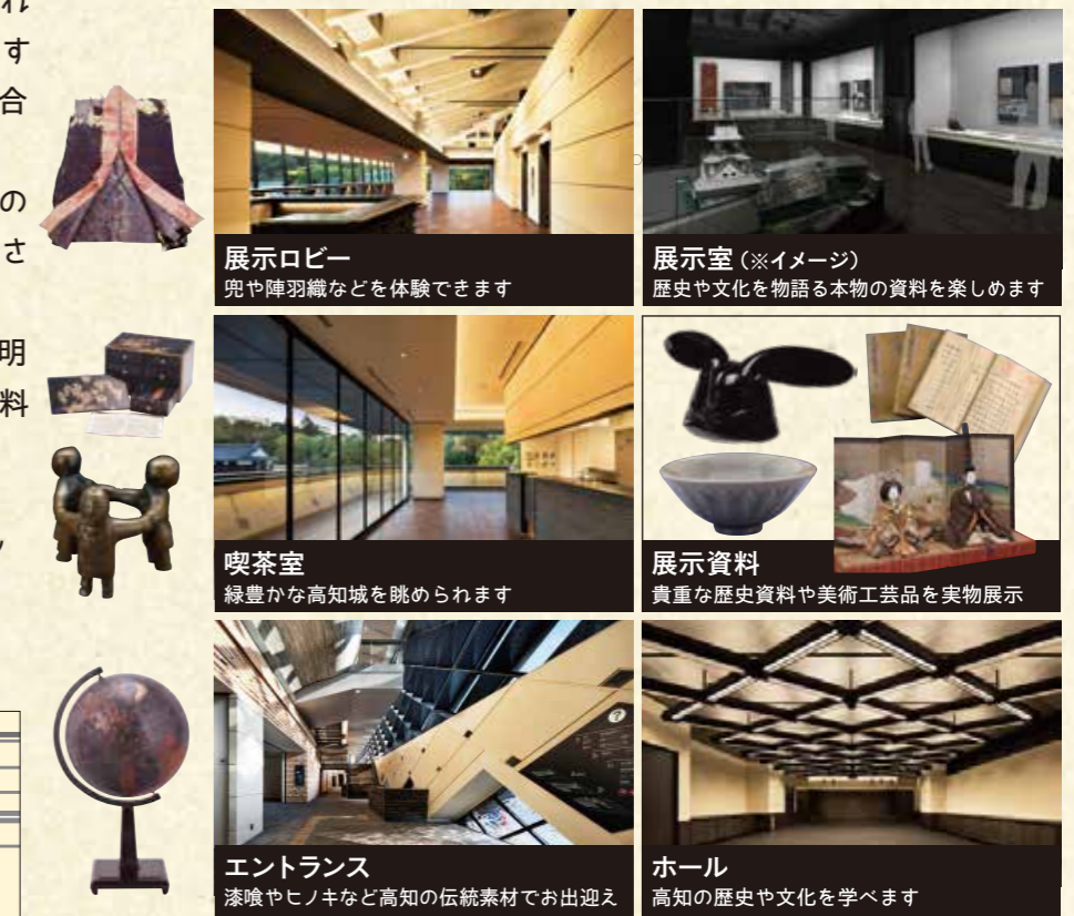
展示ロビー 兜や陣羽織などを体験できます