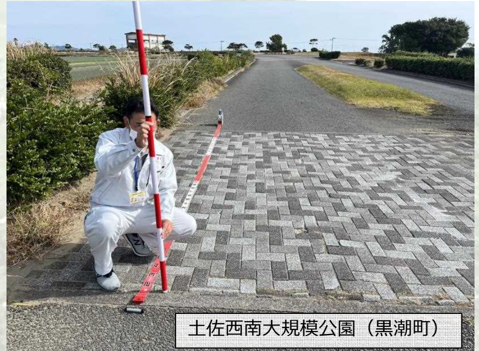
土佐西南大規模公園（黒潮町）