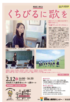
映画「くちびるに歌を」 上映会チラシ