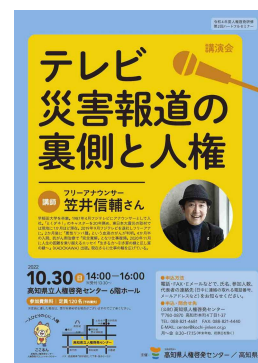
講演会「テレビ災害報道の裏側と人権」 チラシ