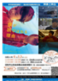
映画「僕が跳びはねる理由」 上映会チラシ