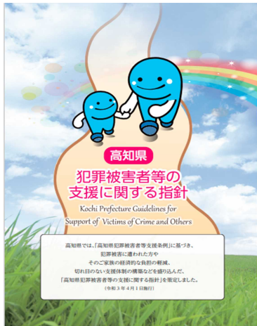
高知県犯罪被害者等の支援に関する指針