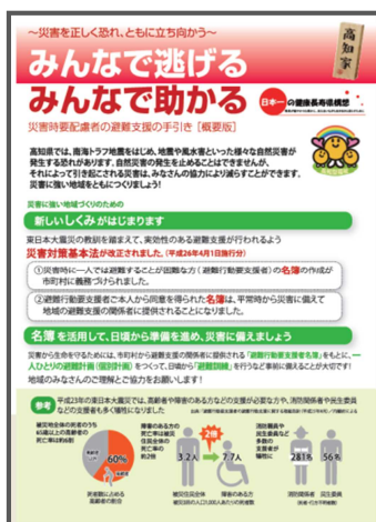
災害時要配慮者の避難支援の手引き (概要版) (平成 26 年 3 月)

災害時や災害後においても災害時要配慮者に対して人権に配慮した適切な対応が行えるよう、要配慮者対策を推進しました。