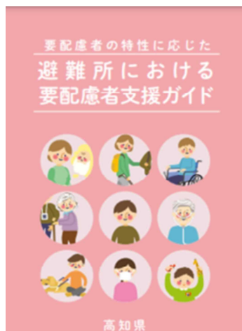
避難所における要配慮者支援ガイド (令和 2 年 8 月)