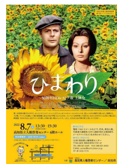
映画「ひまわり」（50周年HDレストア版）上映会