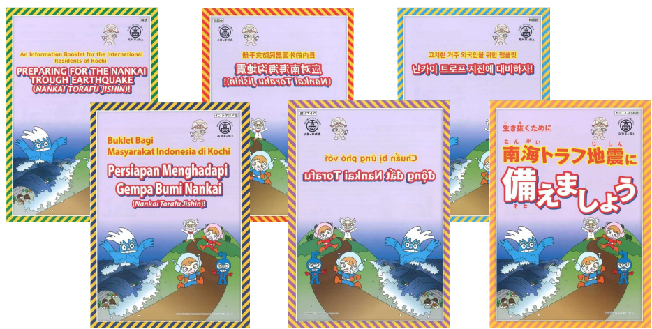
上段左から英語、中国語（簡体字）、韓国語 下段左からインドネシア語、ベトナム語、 やさしい日本語