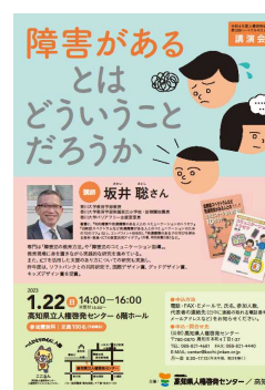
講演会「障害があるとはどういうことだろうか」チラシ