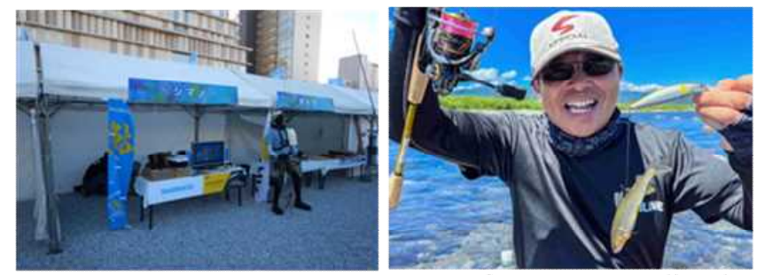
図 こうち天然あゆまつりでのあゆ釣り具展示の様子 図 アユイングの様子