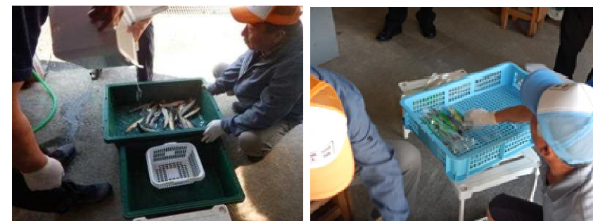
四万十川上流淡水漁協でのあゆの受入・冷凍作業の様子