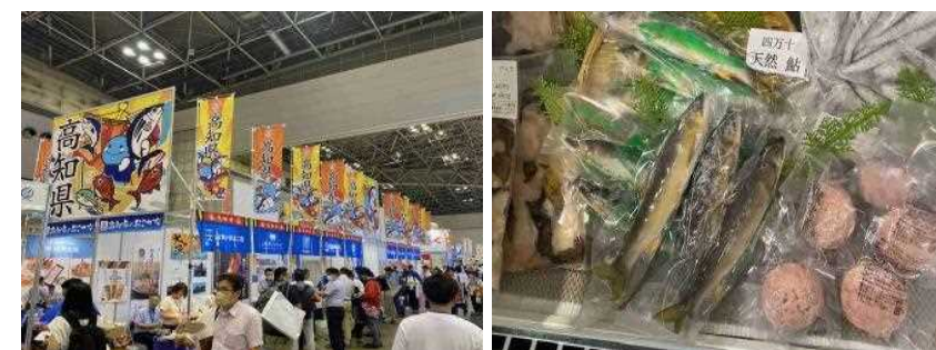
第25回インターナショナルシーフードショーへの出展の様子