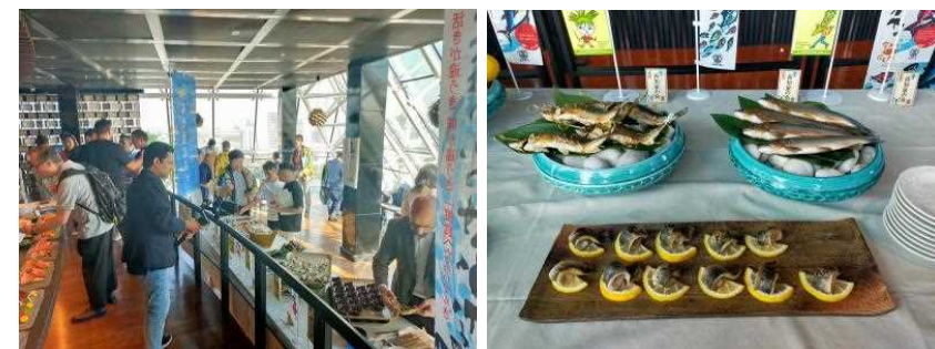
ドバイの日本料理店「TOMO」で開催された賞味会の様子