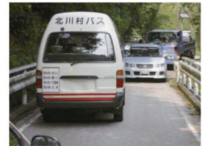
▲幅員が狭隘で通行が困難(国道493号:北川村)

注) 改良延長は、県道以上は車道幅員 5.5m 以上、市町村は 5.5m 未満を含む延長