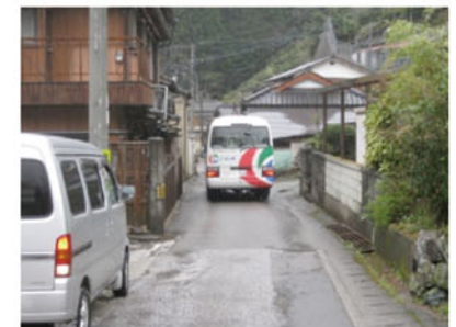
▲幅員が狭隘で通行が困難(県道中津公園線:仁淀川町)