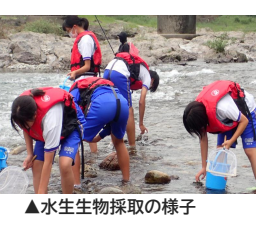
▲水生生物採取の様子