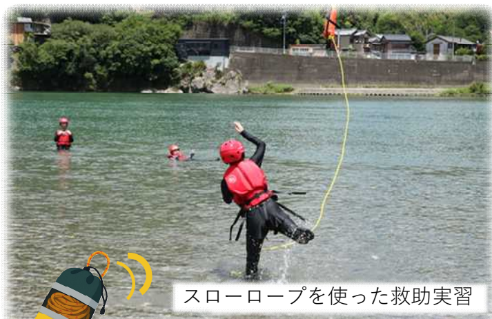
スローロープを使った救助実習

浮き輪などの浮くものを投げたり、浮く素材のスローロープ（スローバック）を使ったり、近くに長い棒などがあればそれを差し伸べます。