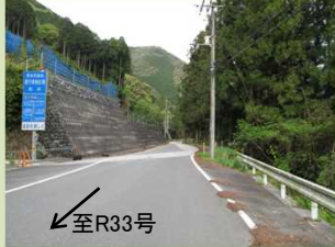
④異常気象時の通行規制区間