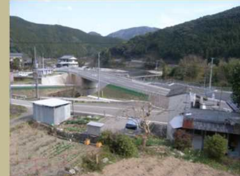
②大型車の通行に支障をきたしている未改良区間