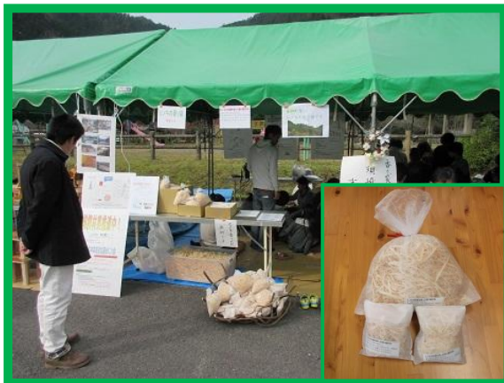
ヒノキの香り袋の配布の様子

クリスマスリースとミニツリー作り教室は終日満員で盛況でした。毎年楽しみにして4回目の参加の方もいました。みなさん思い思いのリースを作り、一つとして同じものはありません。クリスマスを彩る素敵なリースがたくさんできました。