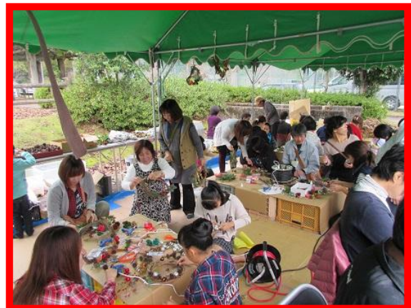
クリスマスリース作りの様子