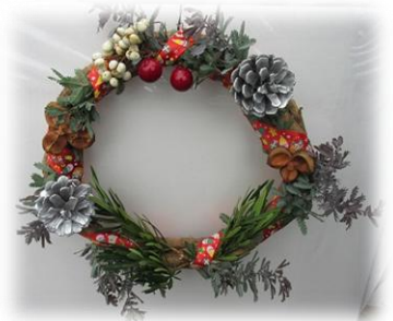
写真は参加された方の作品の一部です