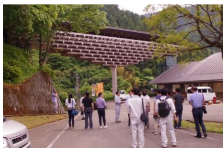
雲の上のギャラリー

今回視察したのは雲の上のギャラリー、梶原町役場、ユスハラ・マルシェの3つの木造建築です。