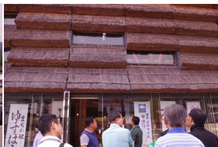
ユスハラ・マルシェ