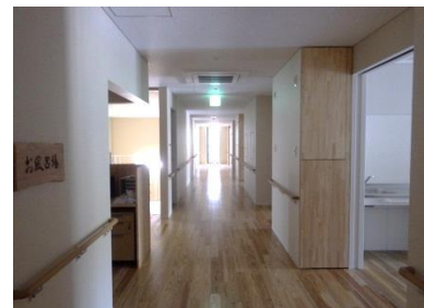
3F 高齢者生活支援ハウス