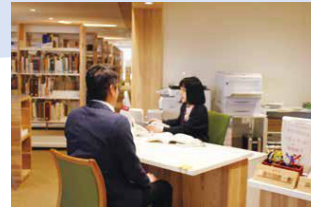
レファレンスの様子