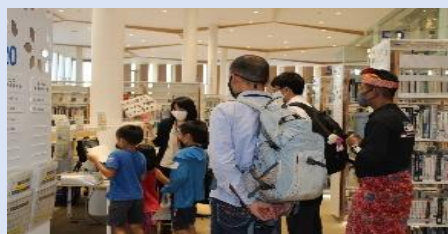
県内在留外国人等を対象としたオーテピア館内ツアー