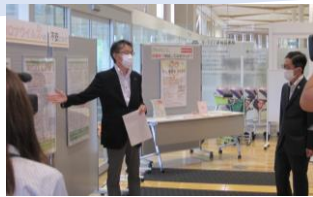
がん患者の感じるコロナウイルスへの不安について(展示説明)