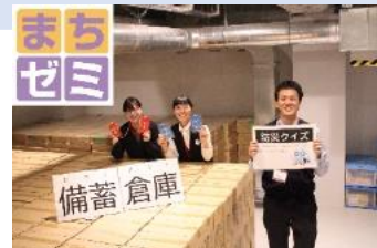
「高知まちゼミ」に参加