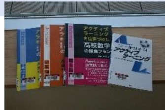
セット貸出し（例） 「アクティブラーニング」