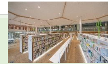
オーテピア高知図書館