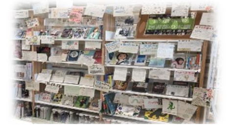
高知農業高等学校図書部との連携展示