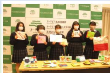
春野高等学校から布絵本の寄贈