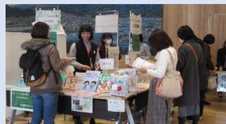
出前図書館(講座等のテーマに合った本を会場で貸し出すサービス)